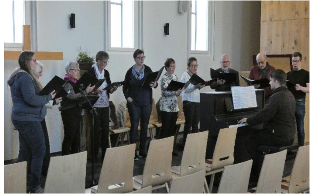
Sing-mit Chor, Abendfeier «Alles hat seine Zeit» Kirchenchor Lütisburg beim Proben der «Missa brevis in F» von Joseph Haydn