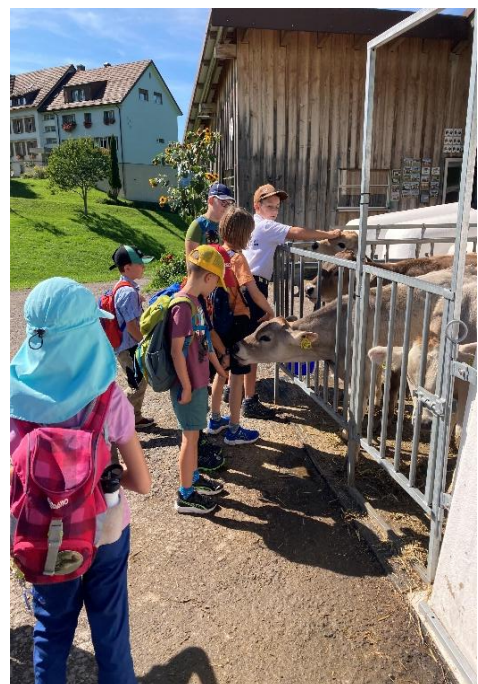
Ausflug auf dem Chnobelweg