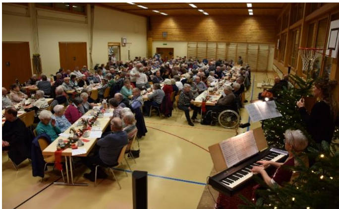
Weihnachtsfeier, Turnhalle Dorf in Bütschwil

Zum Jahresabschluss fanden in Bütschwil, Ganterschwil und Lütisburg die Adventsfeiern statt. Mit einem abwechslungsreichen Programm wurden die Besucherinnen und Besucher auf Weihnachten eingestimmt.