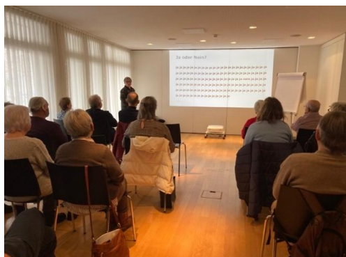
Weiterbildung: Selbstfürsorge Freiwilligenarbeit

In den Gruppen des Werk-b'triebs lernen Menschen ohne feste Anstellung Pünktlichkeit, Zuverlässigkeit und Teamarbeit kennen. Die Kerzenwerkgruppe reinigt zweimal im Monat die Kerzengläser aus den Kirchen von Bütschwil und Ganterschwil und bestückt sie wieder mit neuen Kerzen. Die Frauenwerkgruppe hat in der Küche Köstlichkeiten gebacken oder eingekocht. Andere Teilnehmende haben Dekoartikel, Glückwunsch- und Weihnachtskarten sowie textile Alltagsgegenstände gefertigt. Im textilen Bereich werden Upcycling-Projekte durchgeführt, um die Stoffe von nicht mehr benötigten Kleidungsstücken zu verwerten. Diese Produkte werden während der Öffnungszeiten im b'treff und auf Märkten verkauft. Im Jahr 2025 fanden beim b'treff ein Frühlings- und ein Herbstmarkt mit Produkten aus eigener Herstellung sowie Flohmarktartikeln statt. Die Gaststube war an diesen beiden Tagen sehr gut besucht und es gab viele schöne Begegnungen.