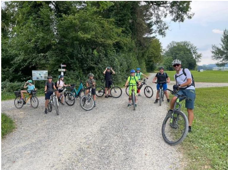
Velotour nach Schaffhausen, Rheinfall