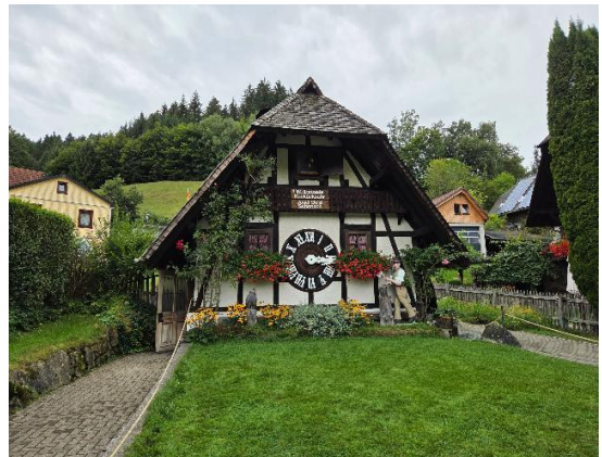
Ferien im Glotterthal