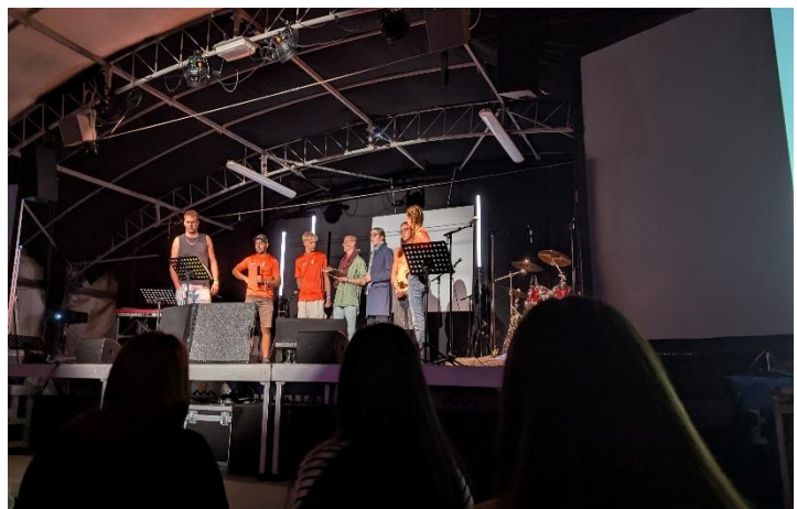
konzipieren, einüben, aufführen