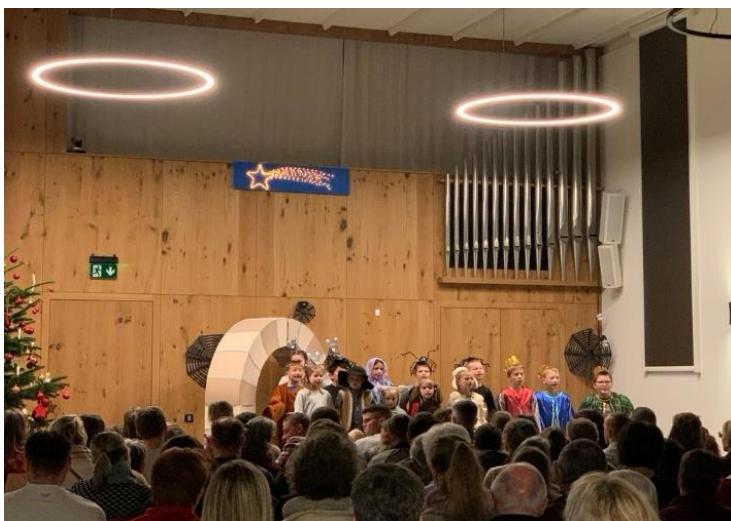
Krippenspiel «En Stall voll Müüs und Spinne»

«KiKi-Spass» und die «Chinderchile BüGaMo» wie auch das «Fiire mit de Chliine» haben in regelmässigen Abständen stattgefunden. Die «Chinderchile BüGaMo» und der «Kiki-Spass» machten am 6. September einen gemeinsamen Ausflug auf dem Chnobelweg im Bächli Hemberg. Auch in diesem Jahr hat die «Chinderchile BüGaMo» eine Sonntagschulshow einstudiert mit der Geschichte von «Jona», die am 26. Oktober in Lütisburg aufgeführt wurde. Die Familielicheirche fand einmal im Monat statt. Das traditionelle Krippenspiel des «KiKi-Spass» mit der Geschichte «En Stall voll Müüs und Spinne» machte an der Sonntagschulweihnacht den Abschluss.