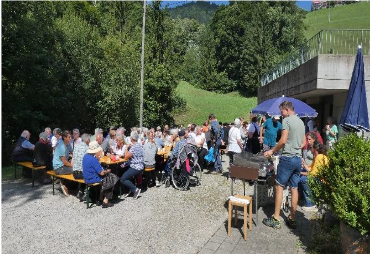
Gemeinsames Mittagessen am Kirchgemeindefest, Grotte Libingen