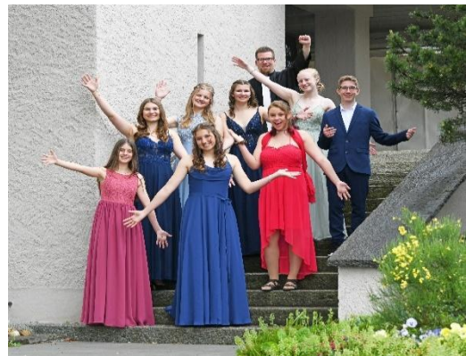
Konfirmation 2 in Lütisburg

Die Kirchenvorsteherschaft hat sich zu zehn ordentlichen Sitzungen und einer kurzen Retraite getroffen. Für das Präsidium steht so gut wie jede Woche auch sonst noch eine Veranstaltung oder Sitzung an.