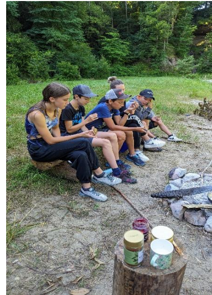
Ausflug ins Pfaffenholz

Zum Ende dieses Jahres können wir also positiv und ermutigt zurückblicken: Die verschiedenen Gruppen wachsen spürbar zusammen. Es ist schön zu sehen, wie die Jugendlichen und jungen Erwachsenen gemeinsam unterwegs sind, voneinander lernen und sich gegenseitig unterstützen. Die Gemeinschaft, die dabei entsteht, bereichert nicht nur die Jugendlichen, sondern auch uns als Leitungsteam.