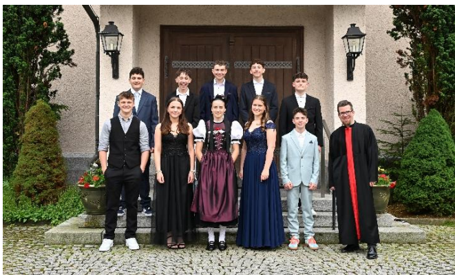
Konfirmation 1 in Bütschwil

In guter Erinnerung bleiben die beiden Konfirmationen, die Taufen, die Gottesdienste mit verschiedenen Chören und ein tolles Kirchgemeindefest, das wir in Libingen gefeiert haben. Zum Kirchenjahr gehören leider auch Abschiede mit Beisetzungen und Abdankungsfeiern. Umso schöner sind Feiern mit Kindern und Jugendlichen. Bei allen Gottesdiensten und anderen Aktivitäten können wir uns auf ein tolles, pflichtbewusstes Pfarrrteam sowie auf motivierte Mitarbeiterinnen und Mitarbeiter verlassen.