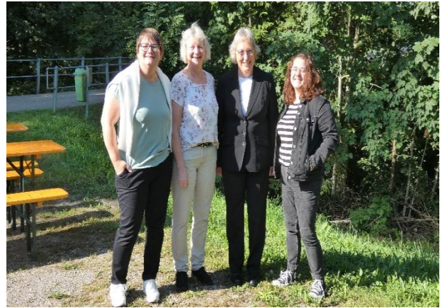
Schönes Zusammensein am Kirchgemeindefest