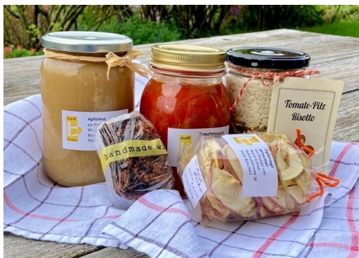
Köstlichkeiten aus der b'treff Küche

Bei der Lebensmittelabgabe erhalten die Bezugsberechtigten günstige Lebensmittel. Wöchentlich nutzen ca. 30 Personen diese Gelegenheit auch um sich auszutauschen und Informationen zu erhalten. Immer wieder erleben wir, wie respektvoll und solidarisch die Menschen während der Abgabe miteinander umgehen.