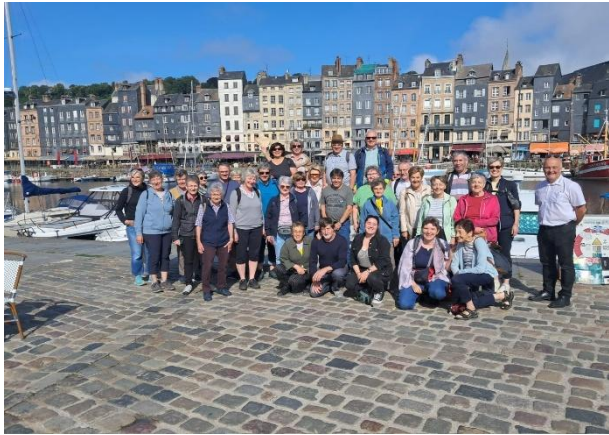
Fischerstädtchen Honfleur, anlässlich der Kirchgemeindereise in die Normandie, Bretagne

Wie ich bereits an der letzten Kirchbürgerversammlung angekündigt habe, werde ich das Amt als Präsidentin abgeben und auch aus der Kirchenvorsteherschaft zurücktreten. Herzlichen Dank, dass Sie mir für die vier Jahre als Mitglied der Kirchenvorsteherschaft und für die letzten vier Jahre als Präsidentin Ihr Vertrauen geschenkt haben.